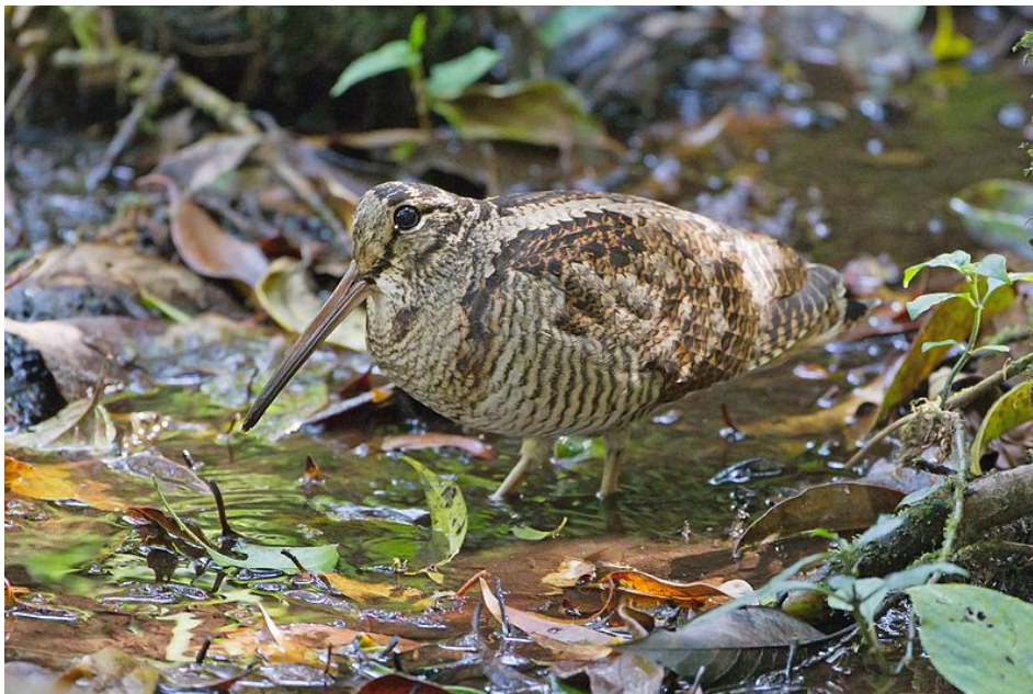
Becada

El aspecto de la becada es más grande y redondeado que las agachadizas –no estando permitida la caza de este última en la Comunidad de Madrid-. El plumaje de la becada es de color marrón rojizo bastante uniforme con numerosas manchas de color negro y blanco. El de la becacina o agachadiza es más claro es su parte inferior. Las franjas claras que poseen en la cabeza son longitudinales en esta última, mientras que en la becada son transversales.