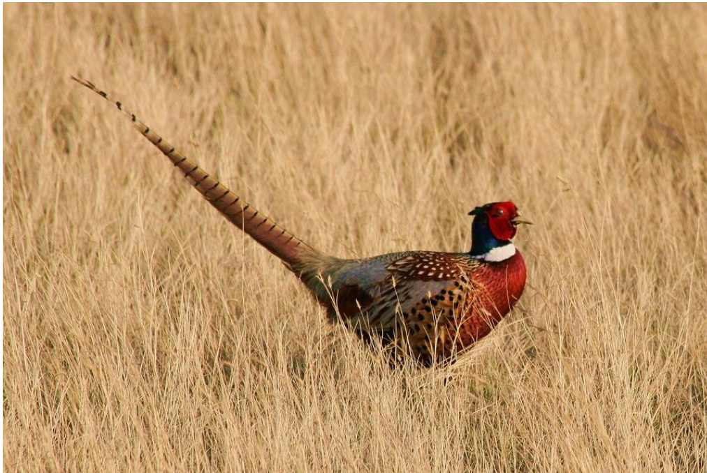
Faisán macho

Esta especie de porte robusto y formas elegantes presenta un claro dimorfismo sexual , caracterizándose sin embargo ambos sexos por una larga cola -20-45 cm-. La longitud varía entre los 50-85 cm y su envergadura alar entre los 70 y 90, siendo la hembra de menor tamaño .