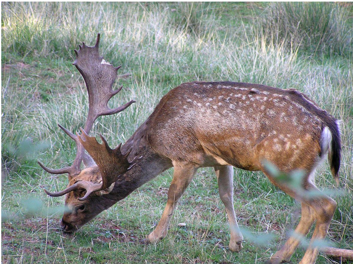
Gamo / Foto: Cosasdebeas - commons.wikimedia.org

Las principales características diferenciadoras de la especie son la cuerna palmeada de los machos, el pelaje moteado de blanco -poco perceptible en el pelaje invernal-, el disco anal blanco bordeado en negro y su tamaño intermedio, 60 kilos de media en machos a 50 en hembras.