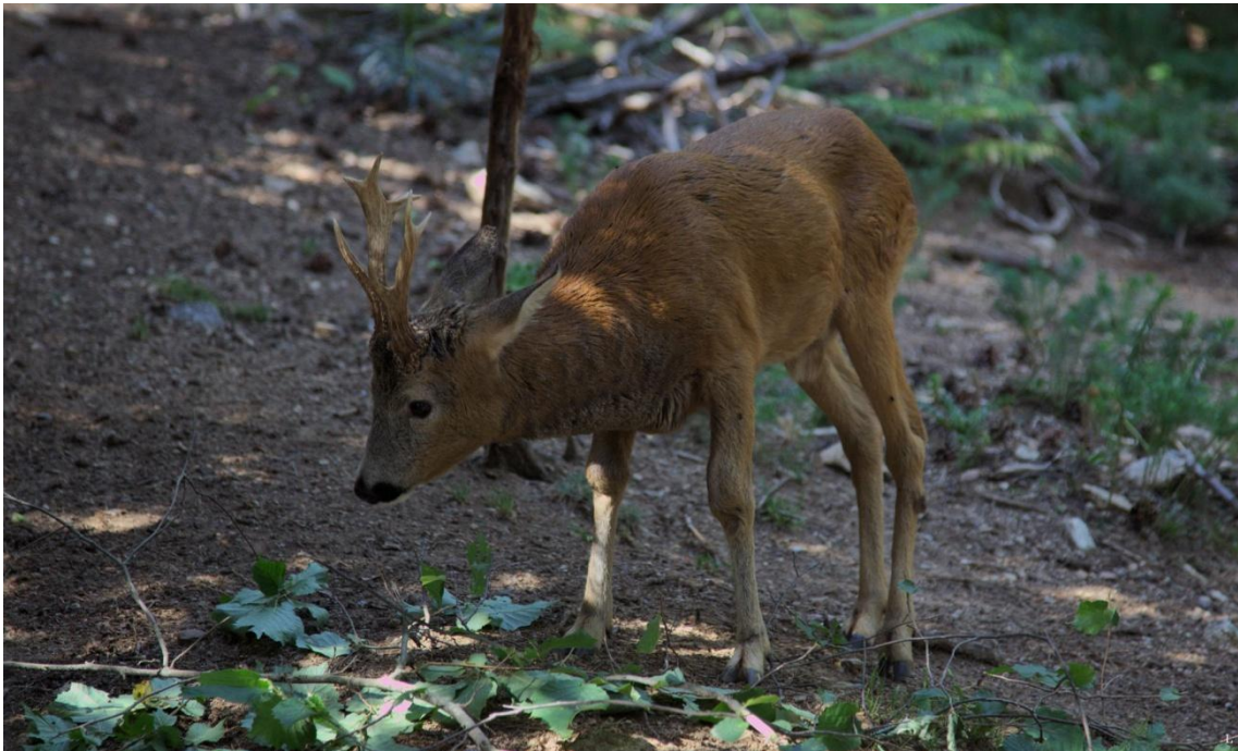
— Corzo ( Capreolus capreolus ).