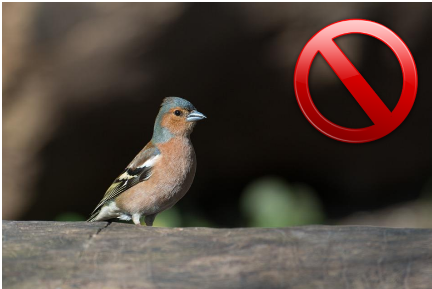
Pinzón Vulgar