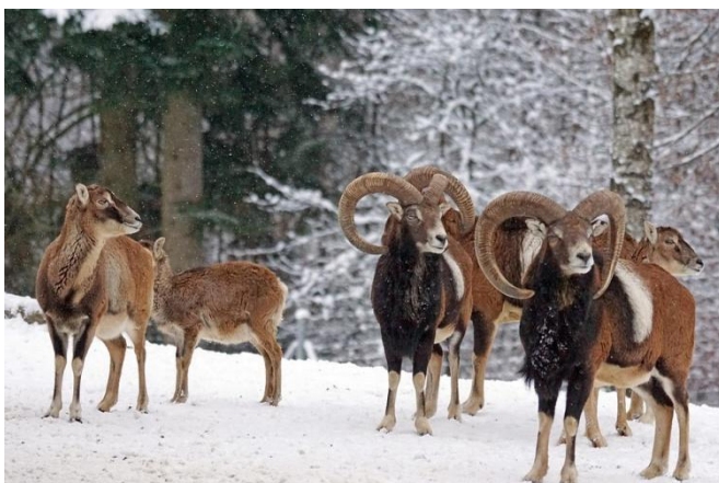
Muflones macho a la derecha, hembras a la izquierda.

Es un animal semejante a una oveja pero de color pardo oscuro con una mancha blanca en forma de silla de montar en los machos . Estos últimos están dotados de grandes cuernos segmentados y curvados en espiral hacia atrás -similares a los del carnero doméstico- y que no tienen nada que ver con los de la cabra montés, como podrás apreciar comparando la siguiente imagen con la mostrada en el punto anterior. La hembra carece de ellos o los tiene de muy escasa longitud.