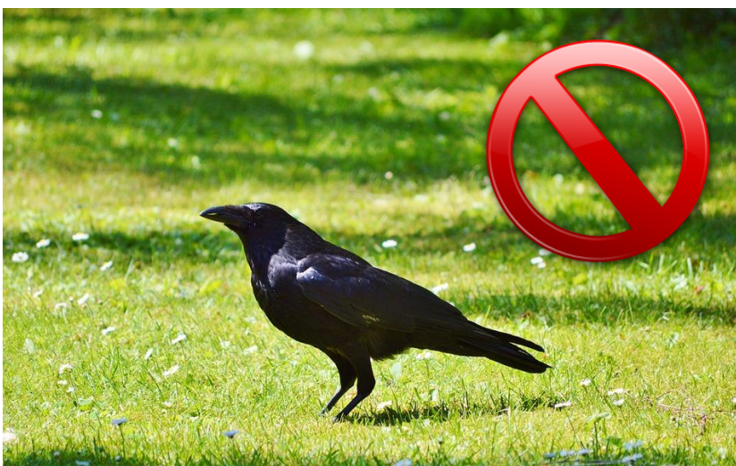
Cuervo / pixabay.com