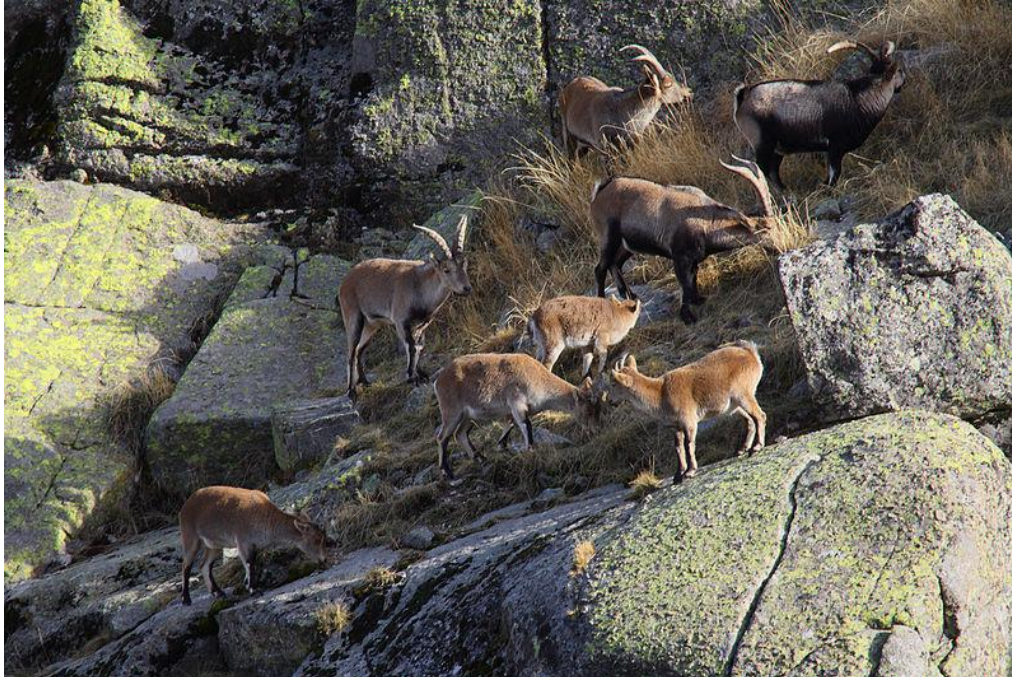
Cabras montesas machos y hembras

La única especie con que podría confundirse en Madrid es con la cabra doméstica . Si bien esta última presenta un pelaje variado muy diferente y es por lo general de menor tamaño . El macho posee una cornamenta más llamativa, es de mayor tamaño y su pelaje tiende a oscurecerse con la edad.