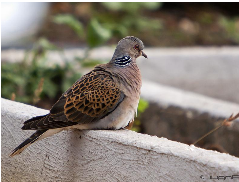
Tórtola común

Pon especial atención a las dos imágenes siguientes para no confundirlas ya que es común en ciertas zonas de Madrid que en una tirada estival de media veda puedan entrar al puesto ejemplares de ambas especies.