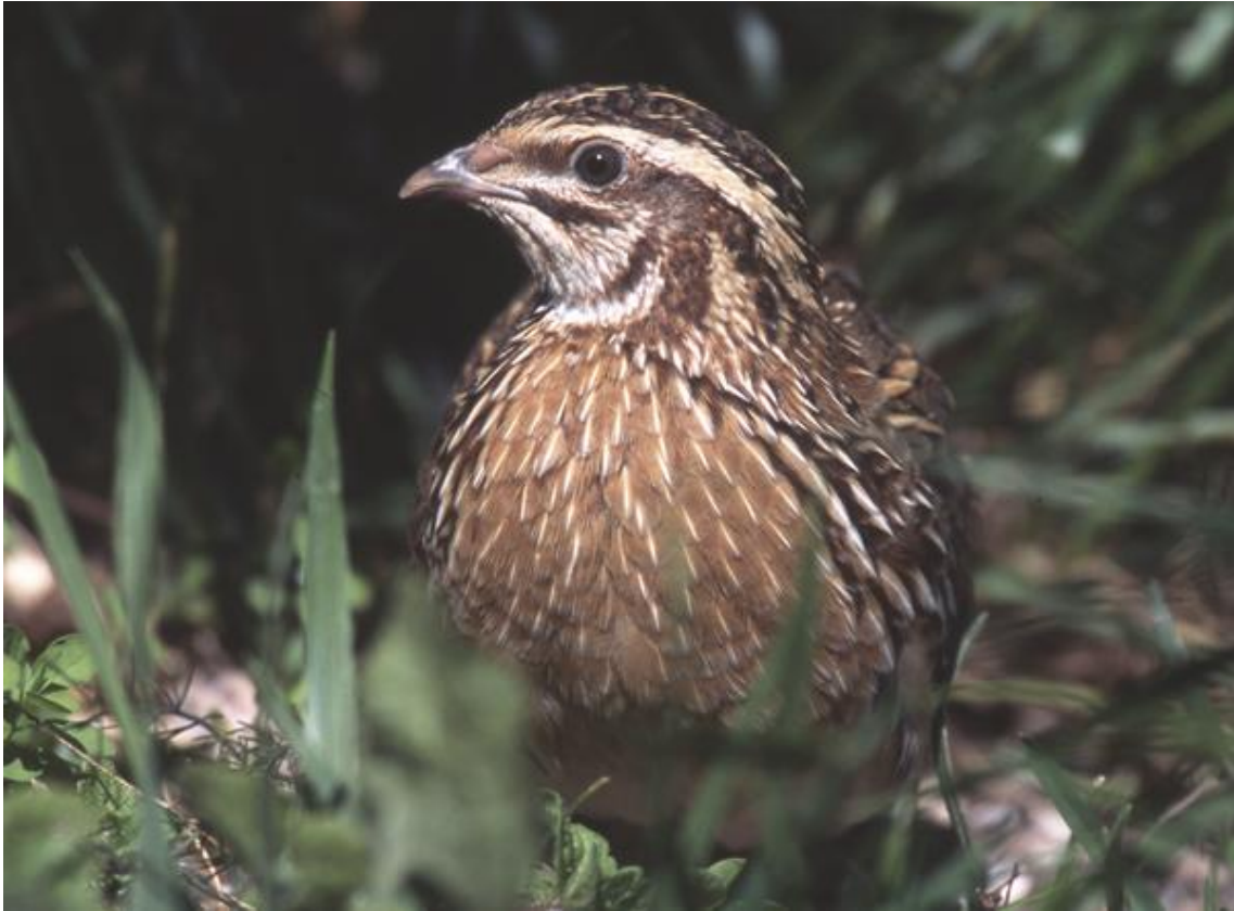
— Codorniz ( Coturnix coturnix ).