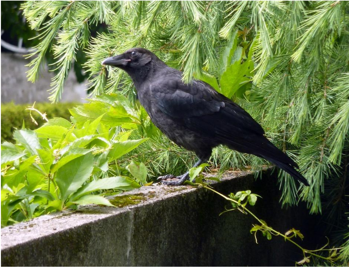
Corneja / pixabay.com