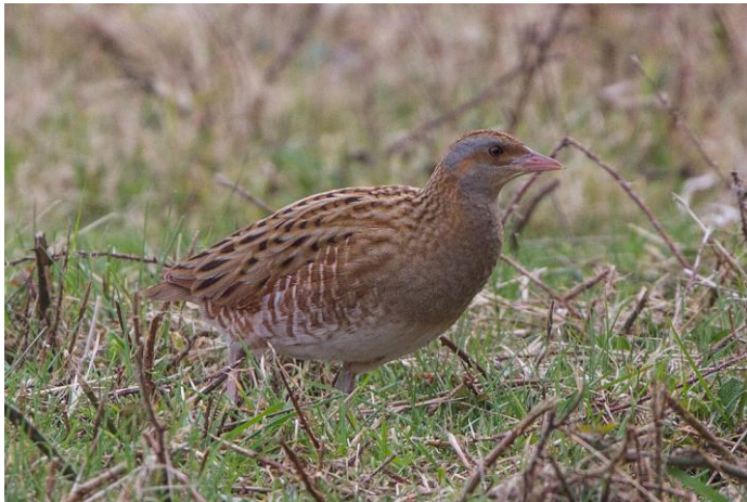
Guión de codornices (Crex crex) / Foto: Ron Knight - commons.wikimedia.org

El solitario y esquivo guión de codornices debe su curioso nombre a la creencia popular de que guiaba a las codornices en sus migraciones anuales, ya que su llegada a tierras europeas se anticipa unos días a la de las pequeñas galliformes. Hoy sabemos que nada hay de cierto en esto y también que, lamentablemente, las poblaciones a nivel mundial de este rálido se encuentran en una situación extremadamente preocupante . Como es evidente su caza está prohibida , no la de la codorniz común, la cual reproducimos a continuación de nuevo junto al guión para que no los confundas.