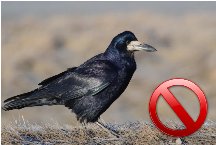
Graja / staticflickr.com