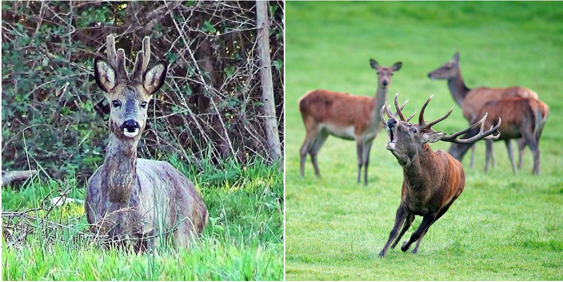
Corzo / Foto: commons.wikimedia.org – Marcial Gijón | Ciervo / Foto: commons.wikimedia.org Lviatour

La longitud de la cuerna, el color de la capa y su comportamiento es diferente. Podrás escuchar al ciervo berrear, nunca a un corzo, este último ladra.