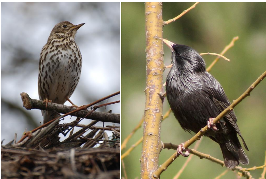
Zorzal común | Estornino negro

Si tienes intención de asistir a una tirada de zorzales, primero debes aprender a distinguirlos del resto de pájaros. Puede parecer sencillo, pero te aseguramos que en vuelo y en determinados momentos con escasa luz, como puede ser el amanecer o el atardecer, no es nada fácil. Fíjate en los siguientes rasgos.