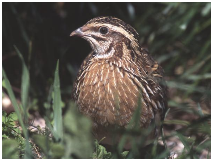
Codorniz (Coturnix coturnix)