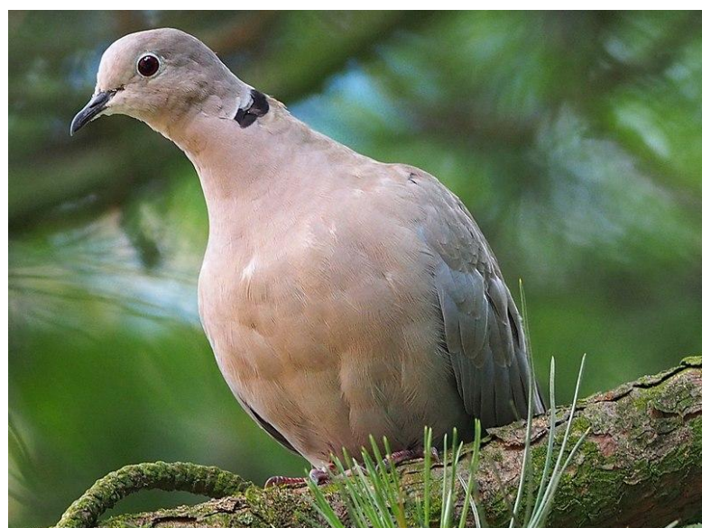
Tórtola turca