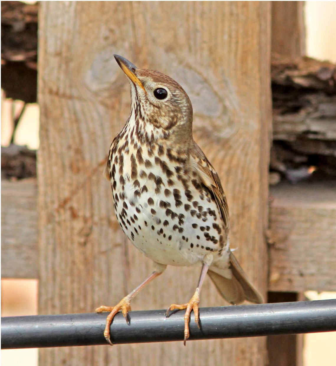
— Zorzal común ( Turdus philomelos ).