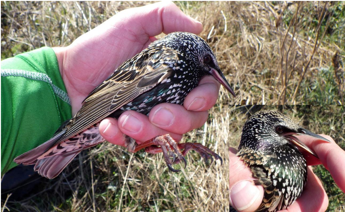
— Estornino pinto ( Sturnus vulgaris ).