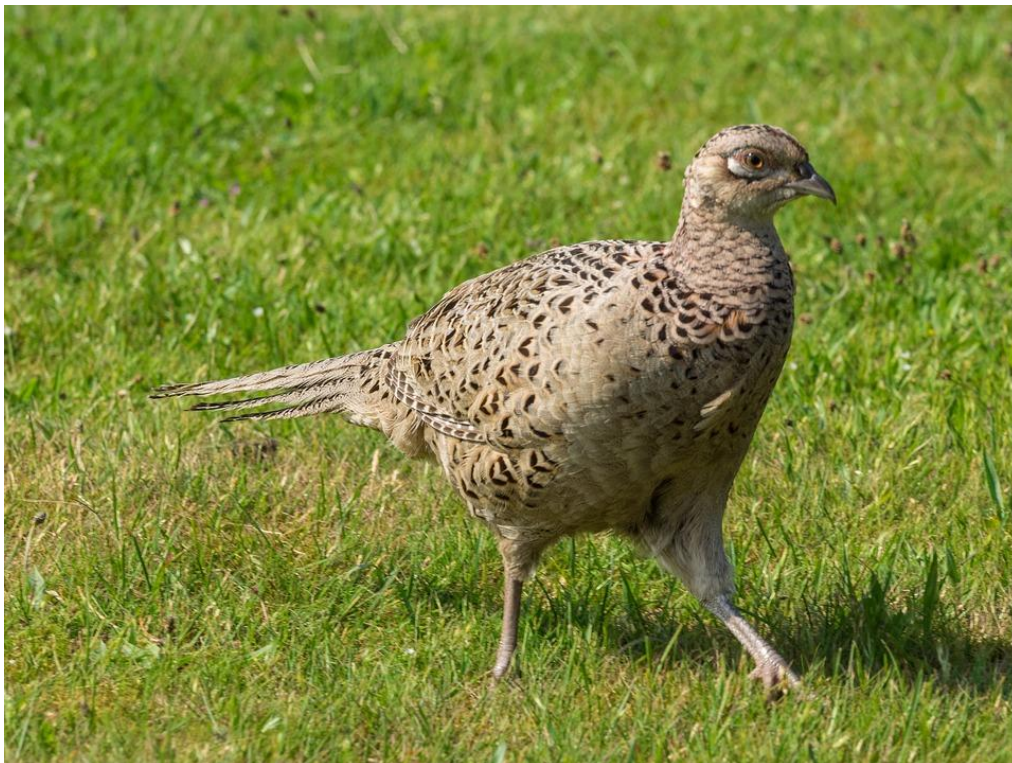
Faisán hembra